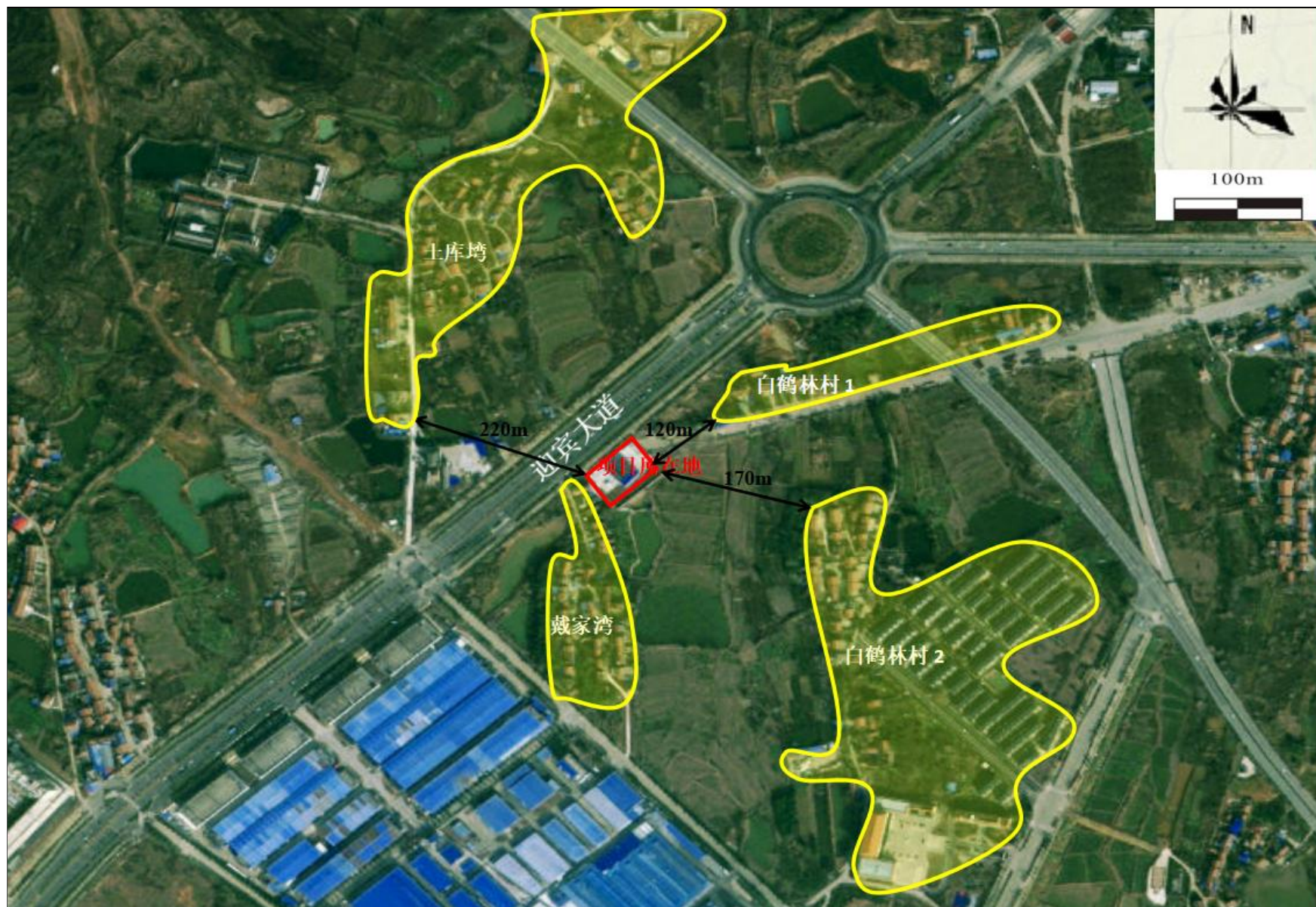
附图 2 项目周边关系示意图