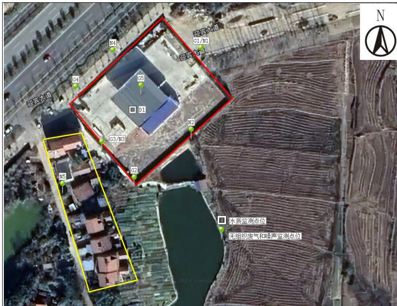
附图 4 项目监测点位图