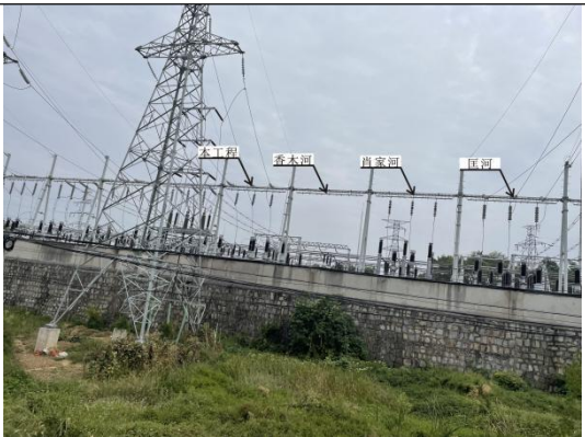
220kV 薄刀峰变电站扩建间隔关系