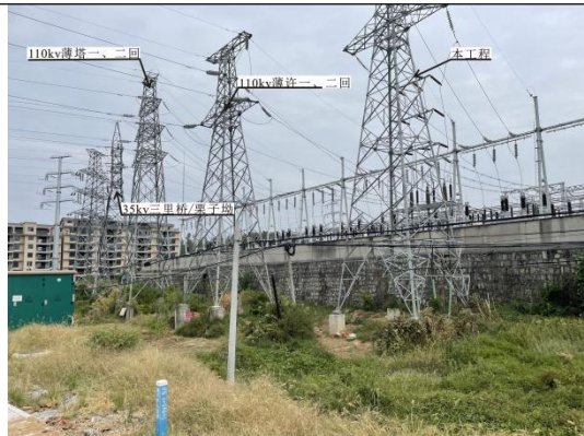
220kV 薄刀峰变电站扩建间隔关系